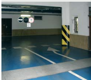
▲ Garáže Navatyp Praha 2 000 m 2