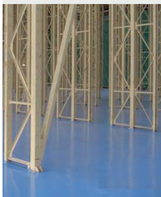
▲ Sanitas Říčany