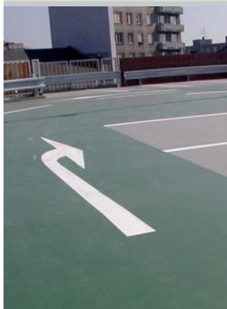
Nadzemní garáže Opava

4 %, stáří betonu min. 28 dní. Ideální je příprava brokováním – metoda Blastrac.