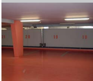
Garáže Terrounská Praha 3 000 m 2