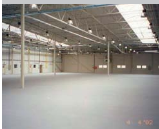
IFE Brno 8 813 m 2